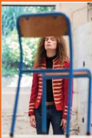
Samedi 6 février à 19h : Théâtre "Conseil de classe" de Geoffrey Rouge Carrassat au Foyer communal

Et oui, la culture est essentielle à l'esprit et aux sens !