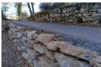
Chemin de la Pommière