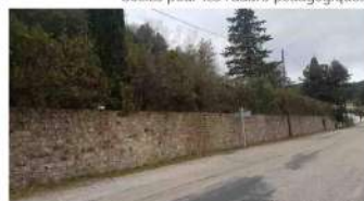
Haie du cimetière