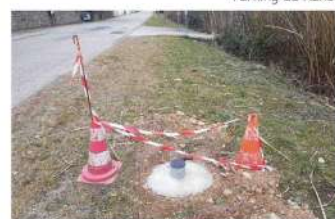
Socles pour les radars pédagogiques