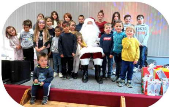
Le Père Noël est bien entouré !