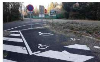
Parking du Ranc