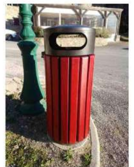
Une poubelle toute neuve, place de la Mairie