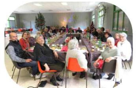
Le repas des aînés