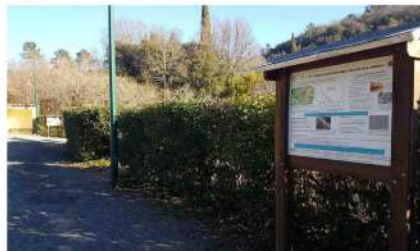
Haie du parking de l'école