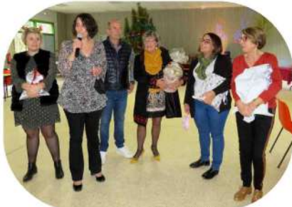
Les membres du CCAS