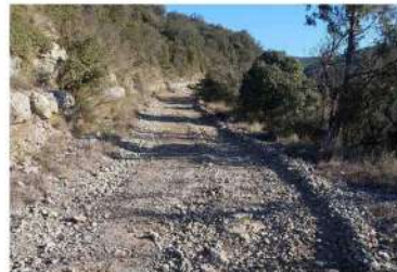
Chemin du Boisset