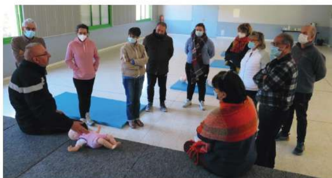
Formation de secourisme du 22 janvier

Au vu de l'intérêt suscité, de nouvelles sessions seront proposées au premier trimestre de l'année prochaine. Les dates vous seront communiquées ultérieurement.