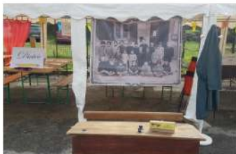
Le coin Dictée