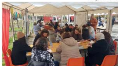
La séance de Dictée