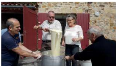
Préparation de l'Aligot