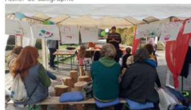
Benjamin de 1001 Mémoires