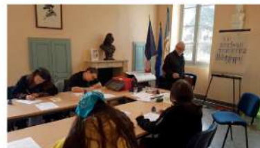
Atelier de Calligraphie