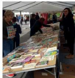
Isalyne de Voyages Culturels