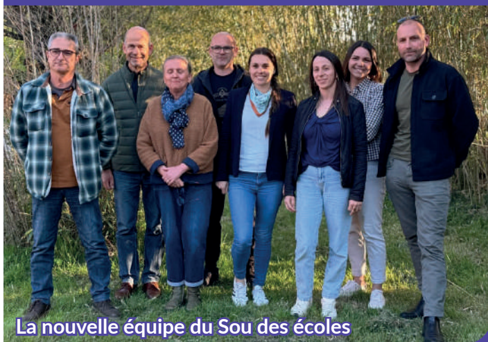
La nouvelle équipe du Sou des écoles